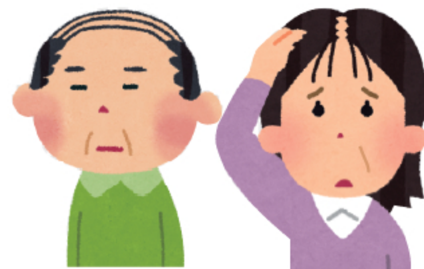
福利厚生の対象は、50歳未満の従業員となります。