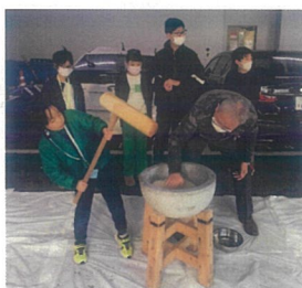
臼と杵を使って自分でお餅をつき体験は、達成感と自信につながる貴重な経験となります。